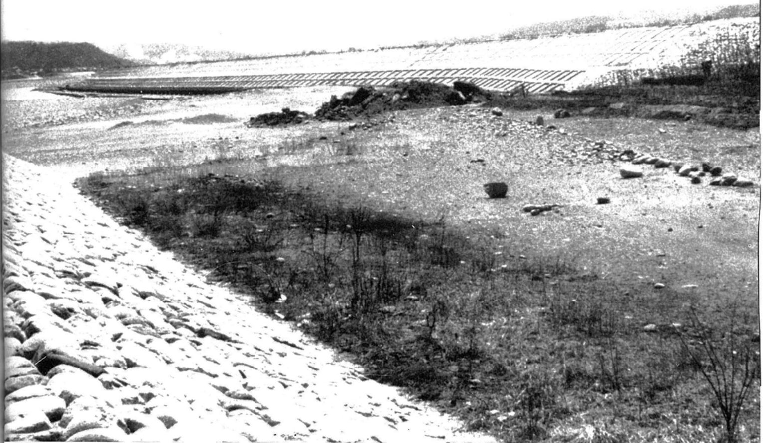
流失した大川除堤(惣兵衛堤防)のあとにできた新堤防 (昭和39年)