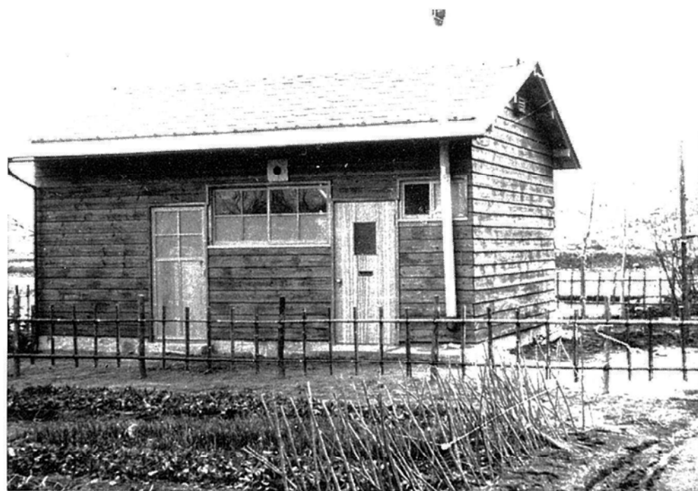
被災者のために急遽建てられた公営住宅第1号 (昭和36年12月)