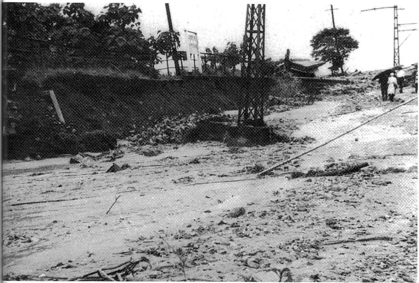
山吹下平駅附近の災害（昭和36年6月27日）