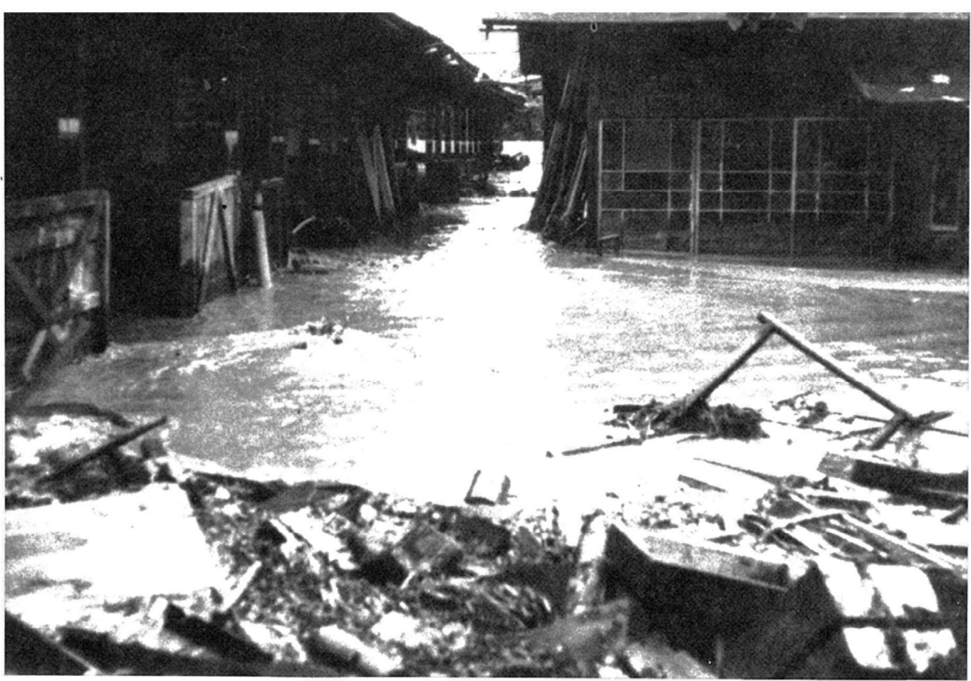
天竜社市田工場構内の惨状 一三六災大島川その2一 (昭和36年6月28日)