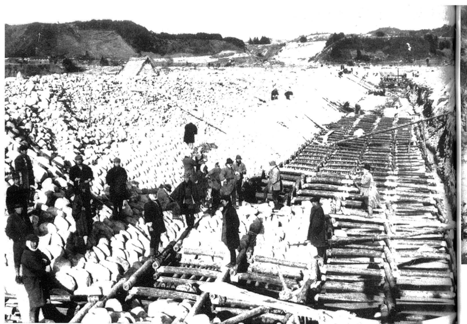
山吹駒場河原の堤防工事 (昭和11年1月30日)