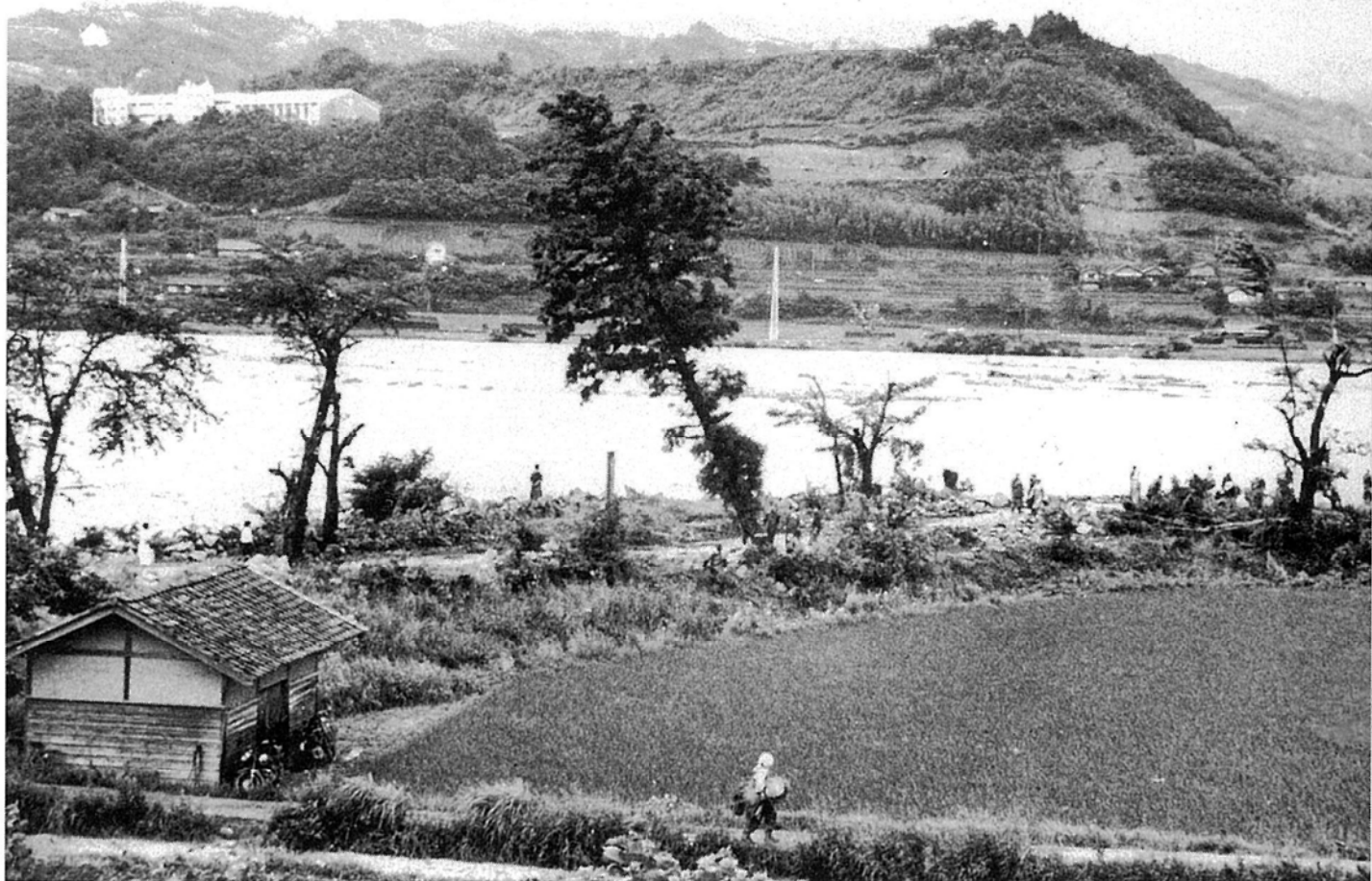
刻々と決壊する下市田大川除堤 一三六災天竜川その2一 (昭和36年6月27日)