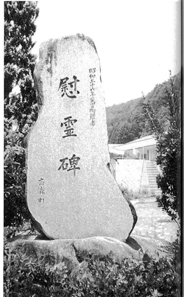
三六災害犠牲者の慰霊碑 — 山吹支所跡 —