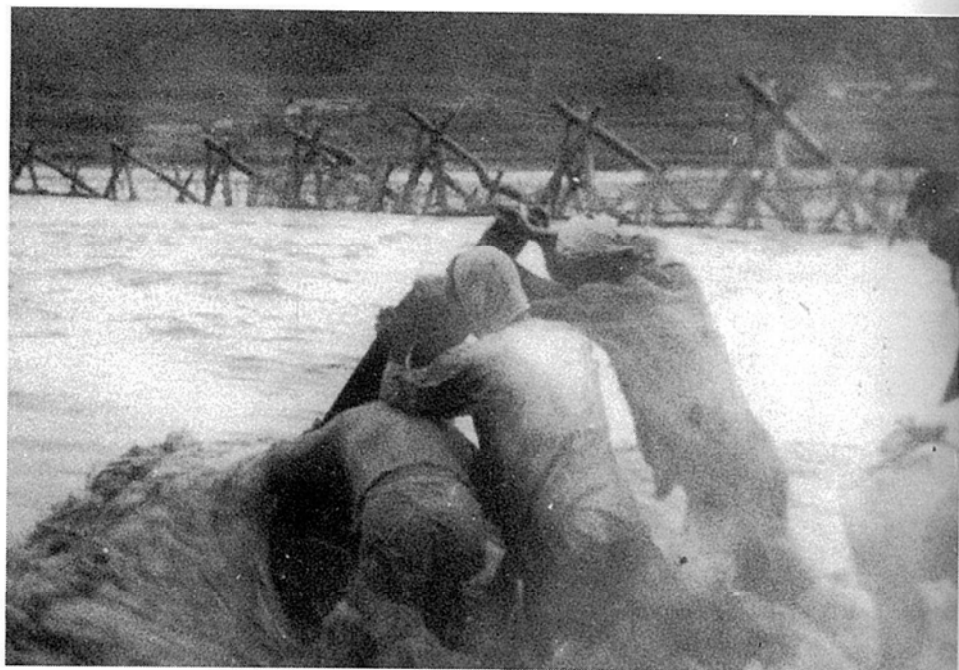
天竜川の水除作業（昭和11年）