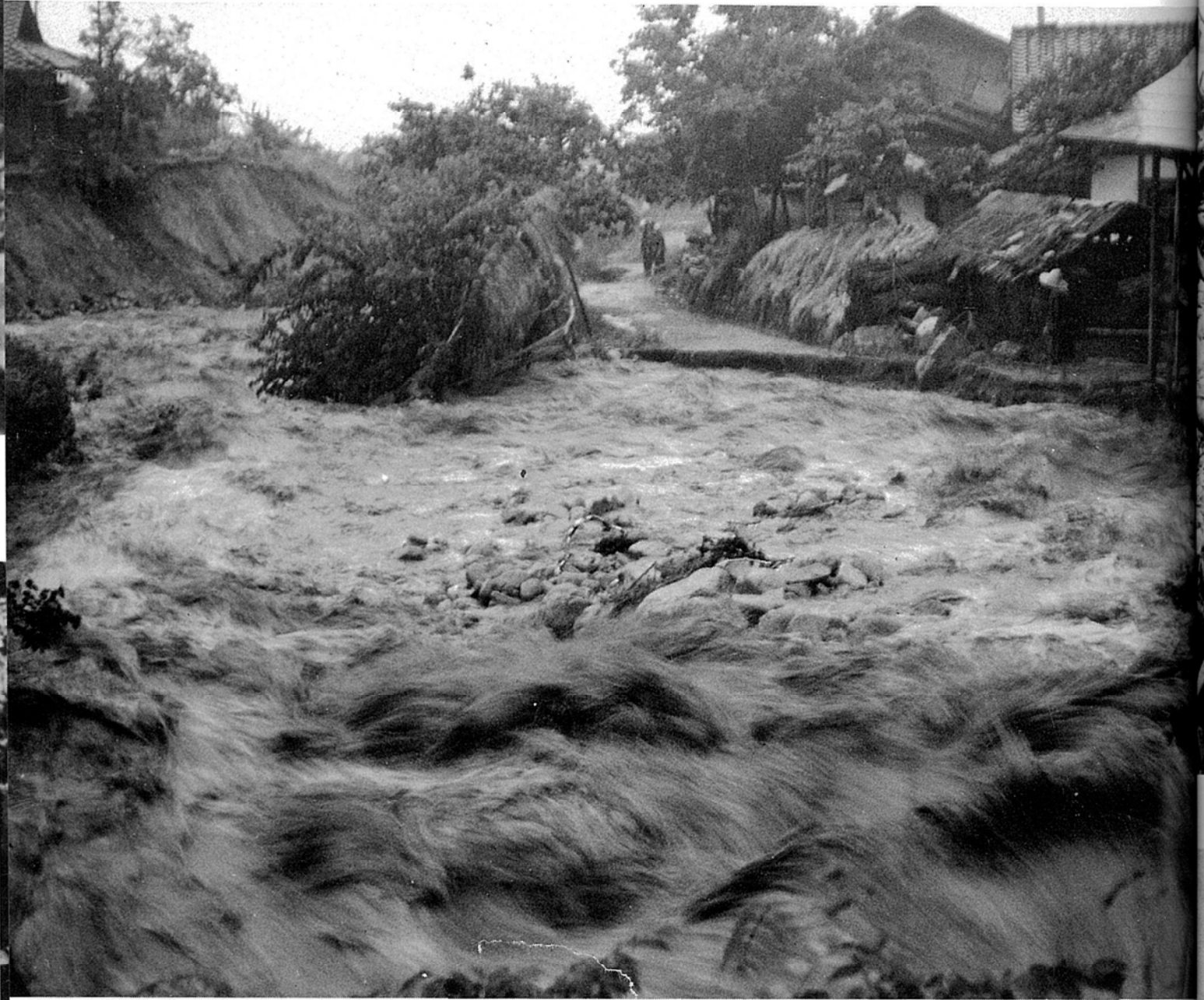
田沢川の大氾濫 一三六災尊い人命多数を失う一 (昭和36年6月27日) (下平附近)