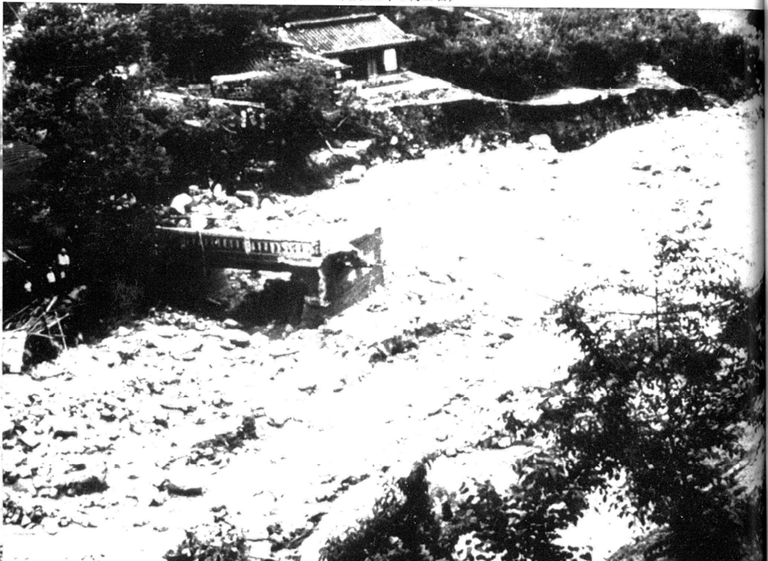
山吹追分橋と附近の災害 一三六災田沢川一 (昭和36年6月27日)