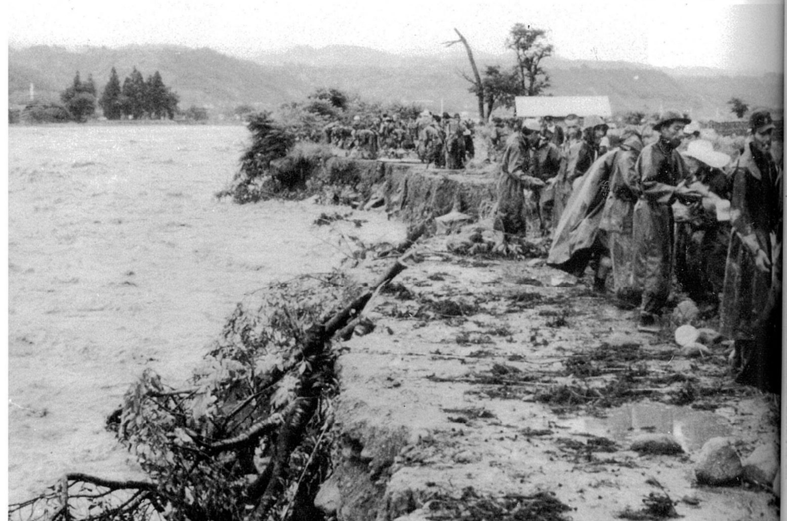
雑木や竹を切り出し、決壊防止につとめる村人たち —三六災天竜川その1—（昭和36年6月27日）