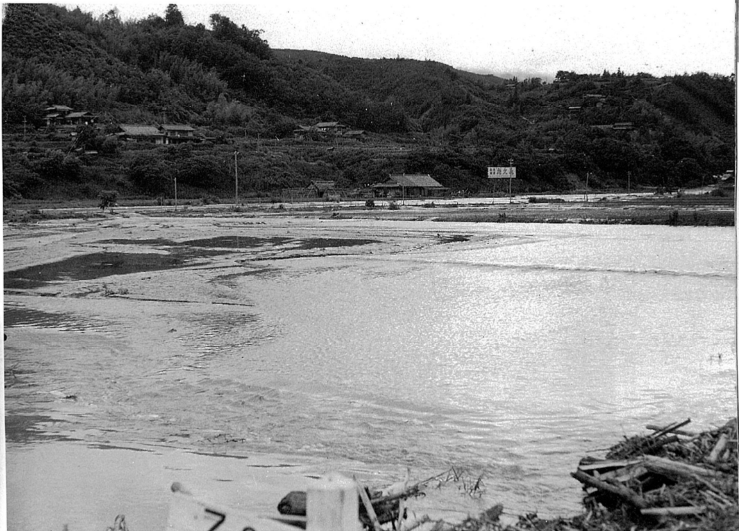
大島川 胡麻目川の大 せき 氾濫 — 吉田河原附近 — （昭和36年6月27日）