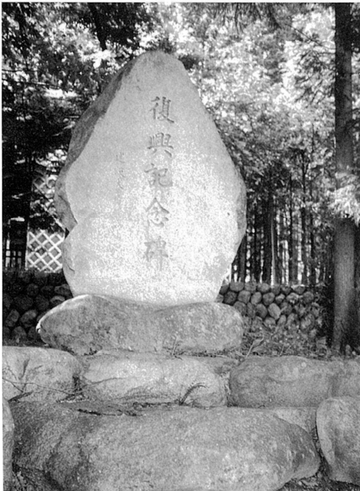
萩山神社境内の三六災害復興記念碑