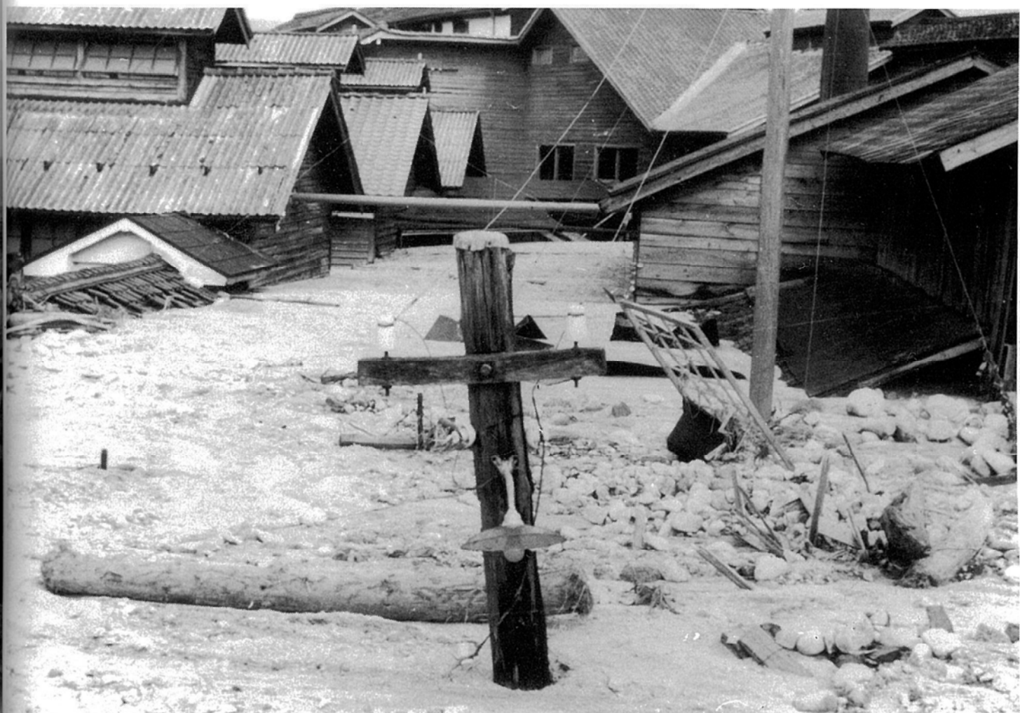
堤防決壊により被害をうけた天竜社市田工場 一三六災大島川その1一 (昭和36年6月28日)