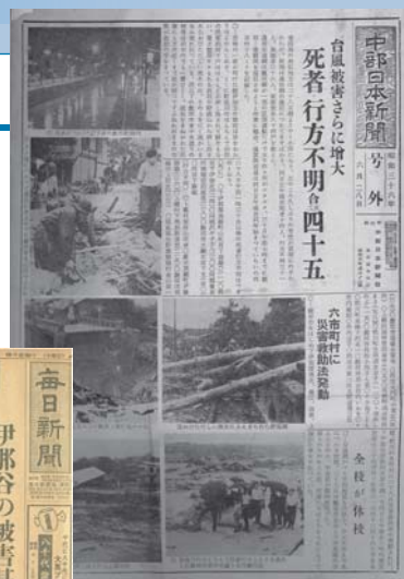
中日新聞 号外 昭和36年6月28日