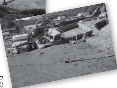
土石流に埋まったトラック (大鹿村大河原)