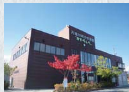
天竜川総合学習館かわらんべ

天竜川総合学習館かわらんべ（長野県飯田市川路7674）に設置する「語り継ぐ“濁流の子”文庫」に、「濁流の子」を含む三六災害等に関連した図書や写真などを収蔵し、公開しています。