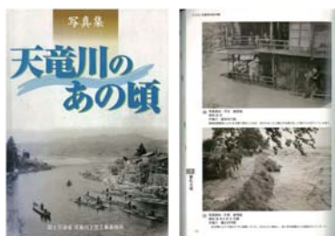
書籍「天竜川のあの頃」 (天竜川上流河川事務所)